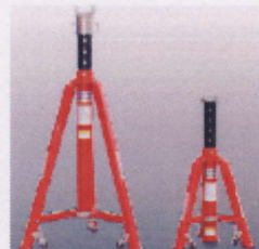
Podpěrné stojany a traverzy

Záruka: od 36 měsíců, záruční a pozáruční servis: MITERAL Brno